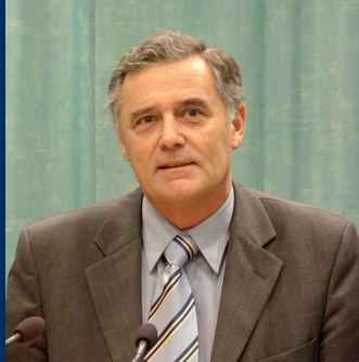
Günther Wurster, Präsident der Bundesakademie für Öffentliche Verwaltung im Bundesministerium des Innern (BAkV)

Mittlerweile weist nahezu jeder Arbeitsbereich in der öffentlichen Verwaltung internationale Aspekte auf. Daher müssen Bedienstete in der öffentlichen Verwaltung noch besser auf das Handeln im internationalen Kontext vorbereitet werden. Eine internationale, vordringlich europäische Kommunikations- und Kooperationsfähigkeit ist hierfür unabdingbar. Ferner müssen die im öffentlichen Dienst Beschäftigten eine größere Kompetenz für Fragen der Governance entwickeln. Schwerpunkt des MEGA-Studiengangs ist es, gerade diese Fähigkeiten zu vermitteln und die Teilnehmerinnen und Teilnehmer zu befähigen, im internationalen und europäischen effektiv aufzutreten.